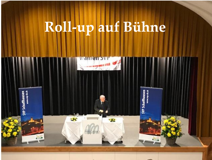
Roll-up auf Bühne