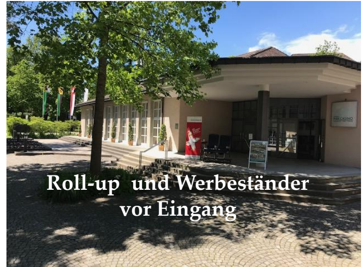
Roll-up und Werbeständer vor Eingang